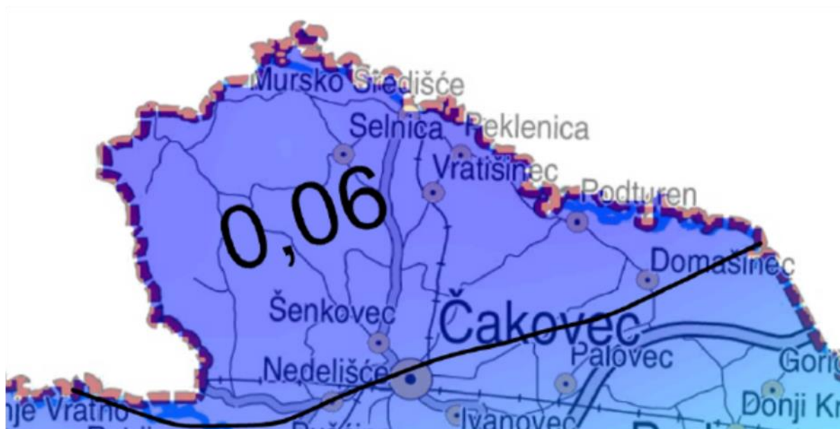
Slika 1. Karta potresnih područja RH, za povratno razdoblje 95 godina