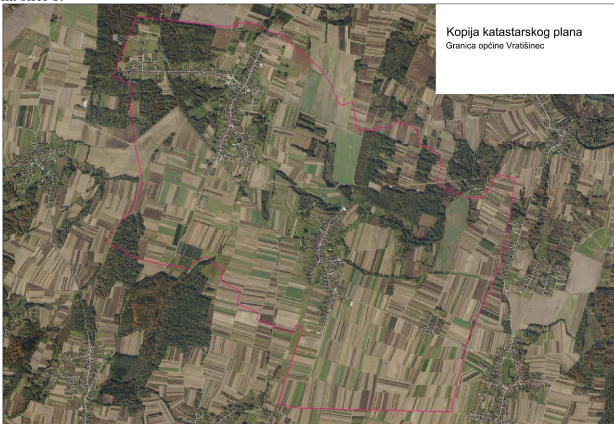
Slika 1: Naselja Općine Vratišinec

Općina Vratišinec smještena je u sjevernom dijelu Međimurske županije, prostire se na površini od 16,2 km 2 i sastoji se od 2 naselja: Vratišinec i Gornji Kraljevac te zaselka Remis, prikazanih na slici 1.